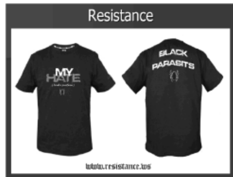
Dos ejemplos “Mi Odio” y “Parásitos Negros”